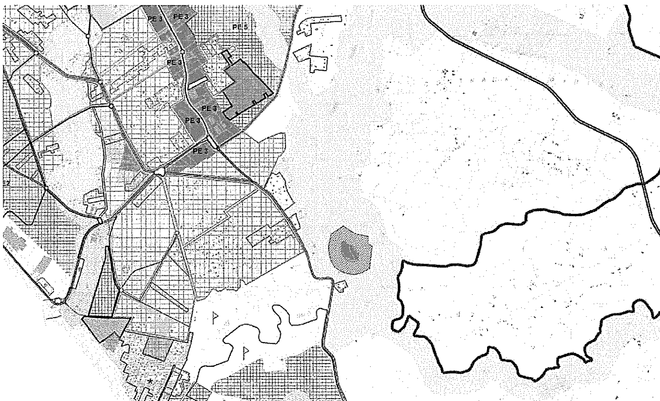
Stralcio tavola P.1.3